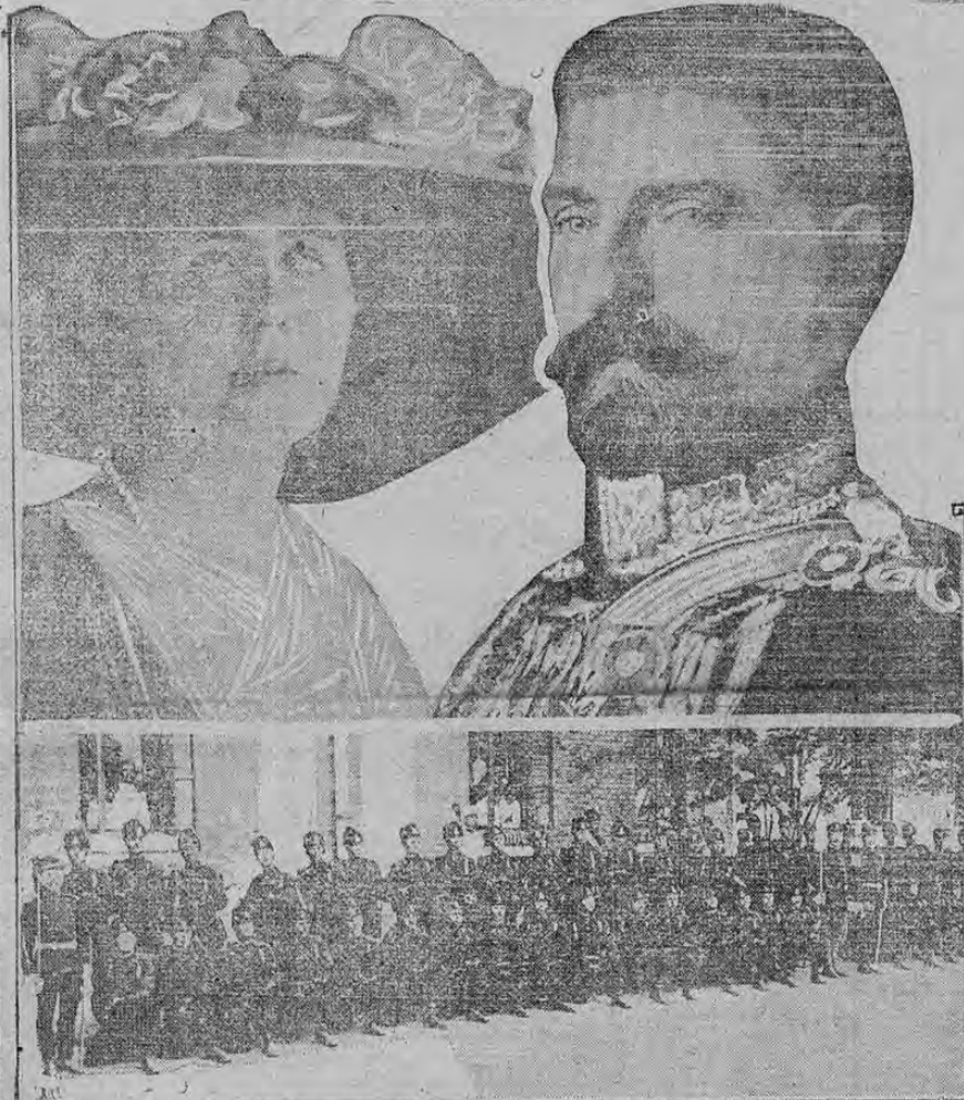
KING AND QUEEN OF RUMANIA - TYPE OF ROUMANIAN SOLDIERS

NUEVO REY Y REINA DE RUMANIA Y EL TIPO DE LOS SOLDADOS QUE PROBABLEMENTE DENTRO DE POCO ENVIARAN A LOS CAMPOS DE BATALLA