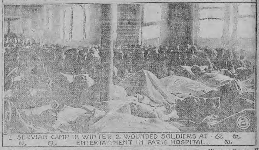
1. SERBIAN CAMP IN WINTER 2. WOUNDED SOLDIERS AT ENTERTAINMENT IN PARIS HOSPITAL.